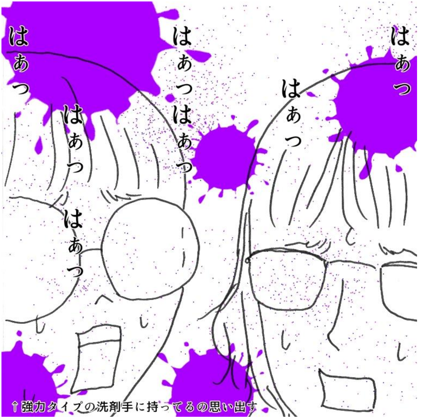
↑ 強力タイプの洗剤手に持っているの思い出す