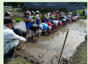
地域の方に教わり田植え

また本年度は、安全対策として跳び箱運搬台車を製作させていただきました。これまで子どもの手で運んでいた重い跳び箱を台車に乗せることで、安全かつスムーズに運搬することができました。時間も節約でき、学習効率も高まりました。ありがとうございました。