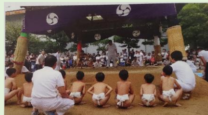
宇美町子ども会相撲大会 197名の子も力士が集結

宇美町子育連では、ソフトバレーボール大会、相撲大会、かるた大会の3大行事の企画運営や、ジュニアリーダーズクラブの活動をサポートしています。助成金は、これらの行事や研修会開催などに活用させていただき、子どもたちの活動の支援に役立てています。お陰様で、宇美町子育連の伝統行事を何十年と続けることができています。ありがとうございました。