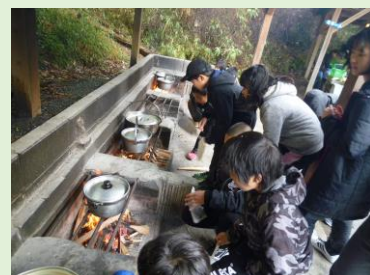
ジュニアリーダーズスクール

今大会は、長崎県のリーダーたちが中心となって進行やまとめ役を担ってくれました。私を含め、他県のリーダーたちも「リーダー」としての在り方や、大変さを学んだと思います。この経験を生かして、まずは町内の年下の子どもたちを上手くまとめられるように頑張りたいと思います。そして、機会があれば積極的に参加し、成長していきたいです。助成金ありがとうございました。