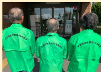
ウインドブレイカー