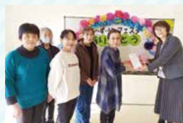
(左)フェルト手芸クラブ (右)宇美町社会福祉協議会 事務局長