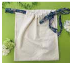
どんな体型にも 優しくフィットします。

鼠径部を締め付けないことで血流やリンパの流れを良くし体を温めます。未病(冷え、肩こり、夜間尿、不眠など)に悩むあなた(男性も女性も)ふんどしパンツを履いて心も体も緩めましょう。