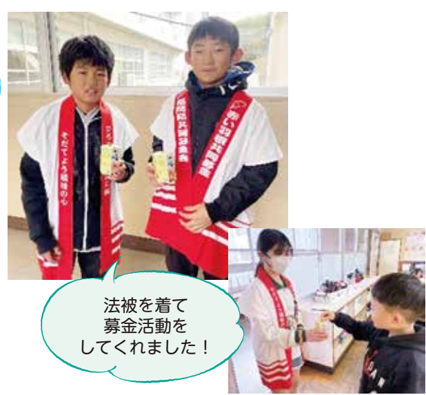
原田小学校募金活動の様子