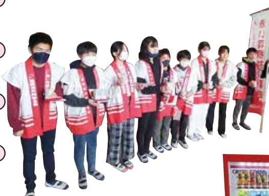
写真：原田小学校募金活動の様子