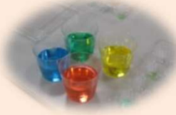
大人も夢中になる 色水遊び

講習会では、ワークショップ形式で子育てについて話し合ったり、心肺蘇生の実技やAEDの取扱い方を学んだりしました。童心に帰って楽しむ時間もあり、和やかな雰囲気の中で受講されていました。皆さんの感想をご紹介します。